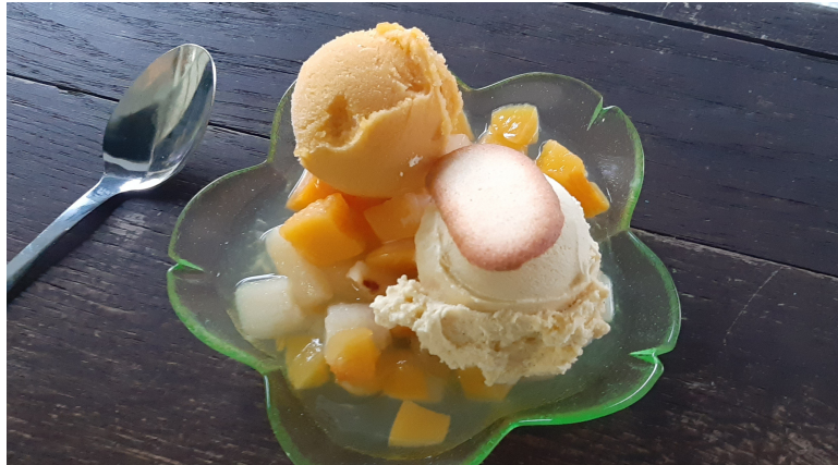
Salade de Fruits : 3.00€