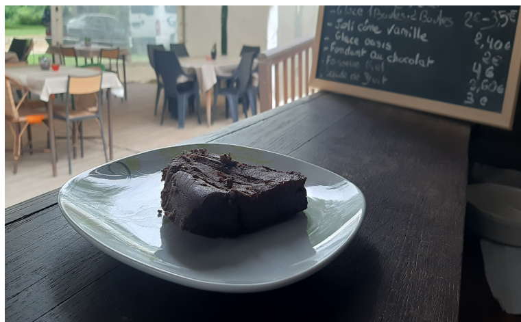
Fondant au Chocolat : 4.00€