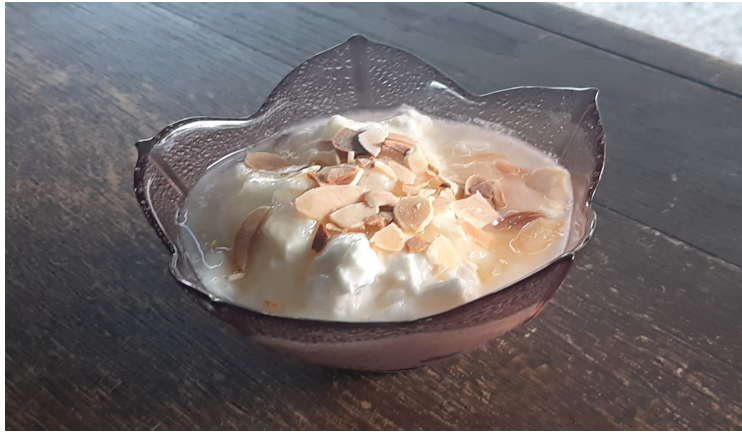
Faisselle au Miel avec Amandes : 4.00€